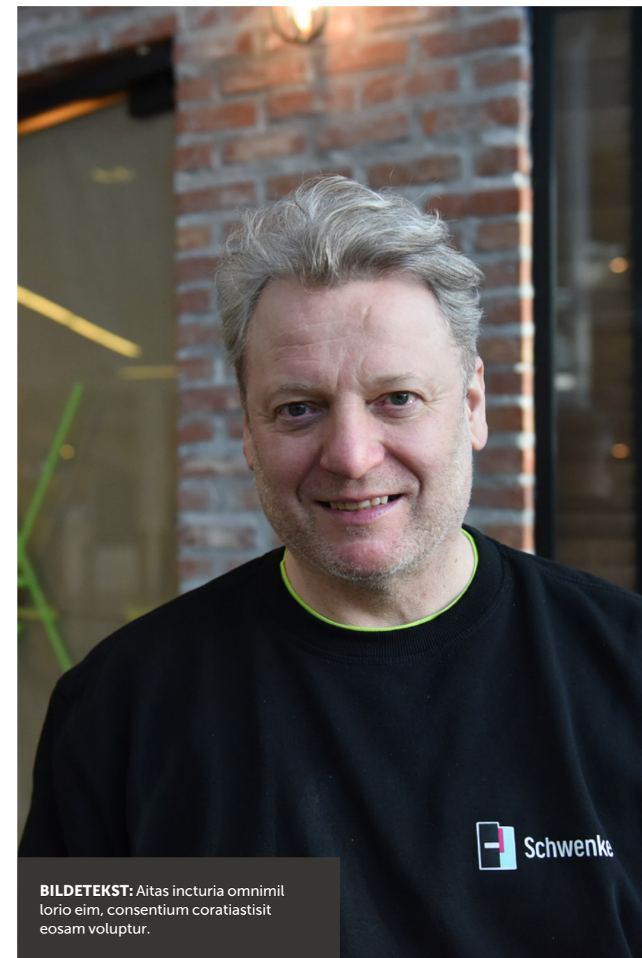
BILDETEKST: Aitas incturia omnimil lorio eim, consentium coratiastisit eosam voluptur.