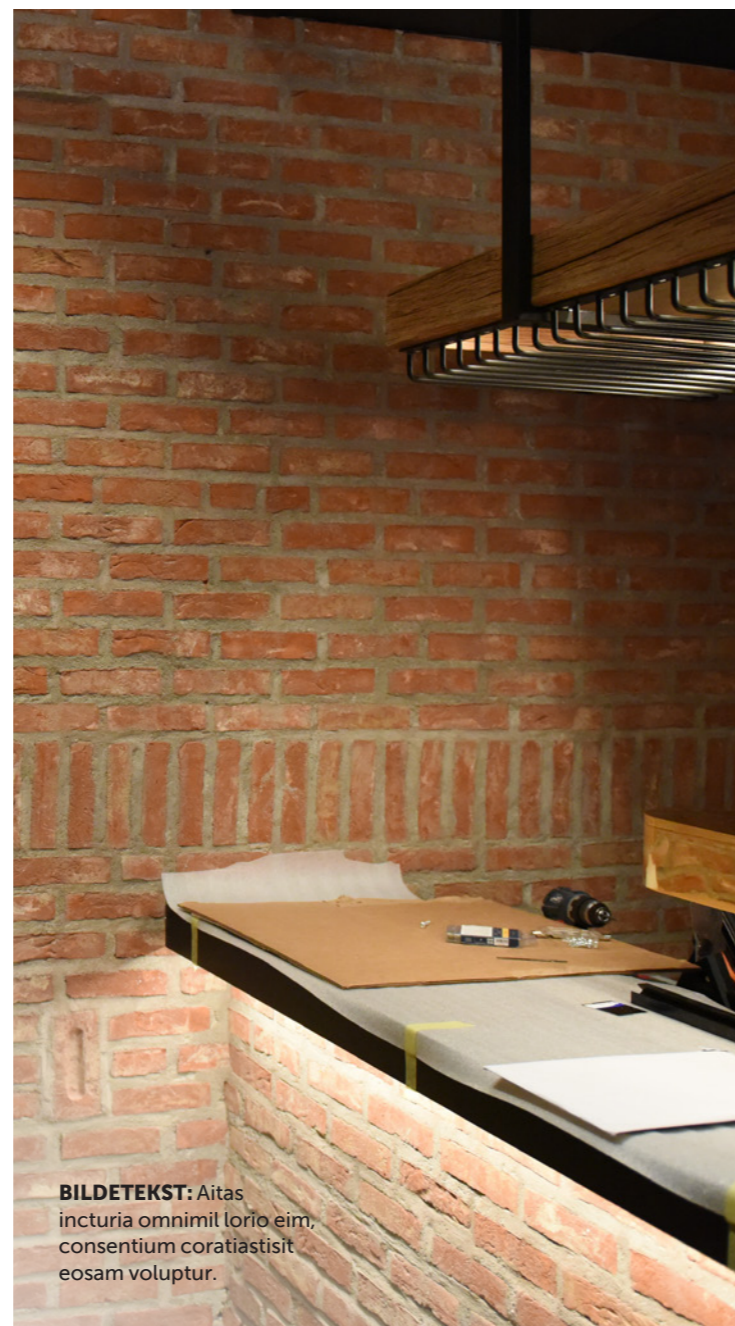
BILDETEKST: Aitas incturia omnimil lorio eim, consentium coratiastisit eosam voluptur.

- Her har de ønsket både steiner og mur på høykant. De er ikke opptatt av skiftegang, så der har vi stått helt fritt til å gjøre hva vi ville. Det har faktisk vært bedre mer så mange krumspring som mulig. Her hadde vi en gammelmester i sving som virkelig fikk bryne seg med